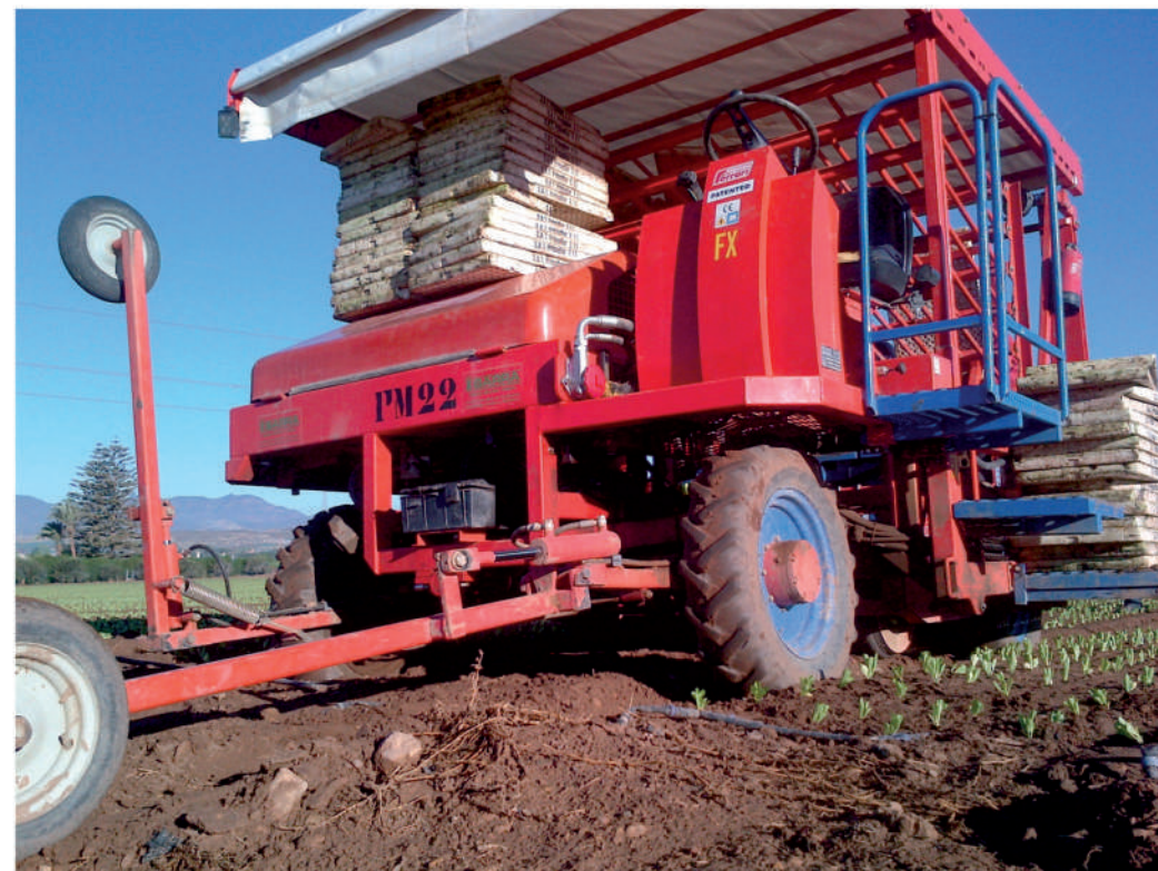
VERSIONE SEMOVENTE | SELF PROPELLED VERSION | VERSION AUTOMOTRICE SELBSTFAHRENDE AUSFÜHRUNG | САМОХОДНАЯ ВЕРСИЯ | VERSION AUTOPROPULSADA

Il presente catalogo è da intendersi non vincolante causa la continua ricerca nella quale la nostra ditta è impegnata / This catalogue is not a binding one cause our firm is continuously engaged in research works/ Ce catalogue-ci ne lie pas parce que notre maison est toujours engagée dans un travail de recherche continue/ der vorliegende katalog ist nicht bindend, weil unsere firma mit einer ununterbrochenen forschung beschäftigt ist / Этот каталог не имеет обязательной силы из-за продолжающихся исследований, в которых наша фирма постоянно занята.